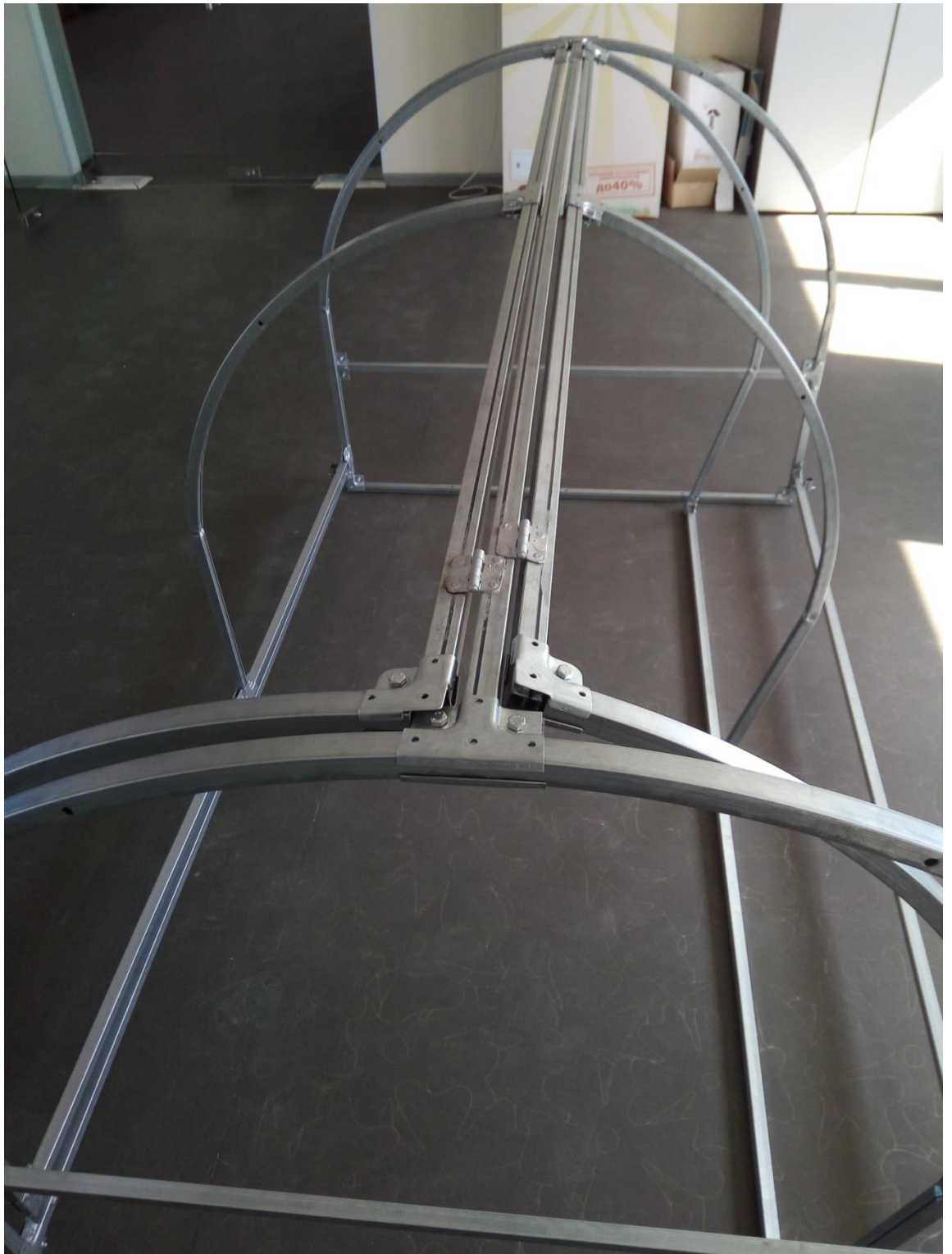
5. Установка упоров