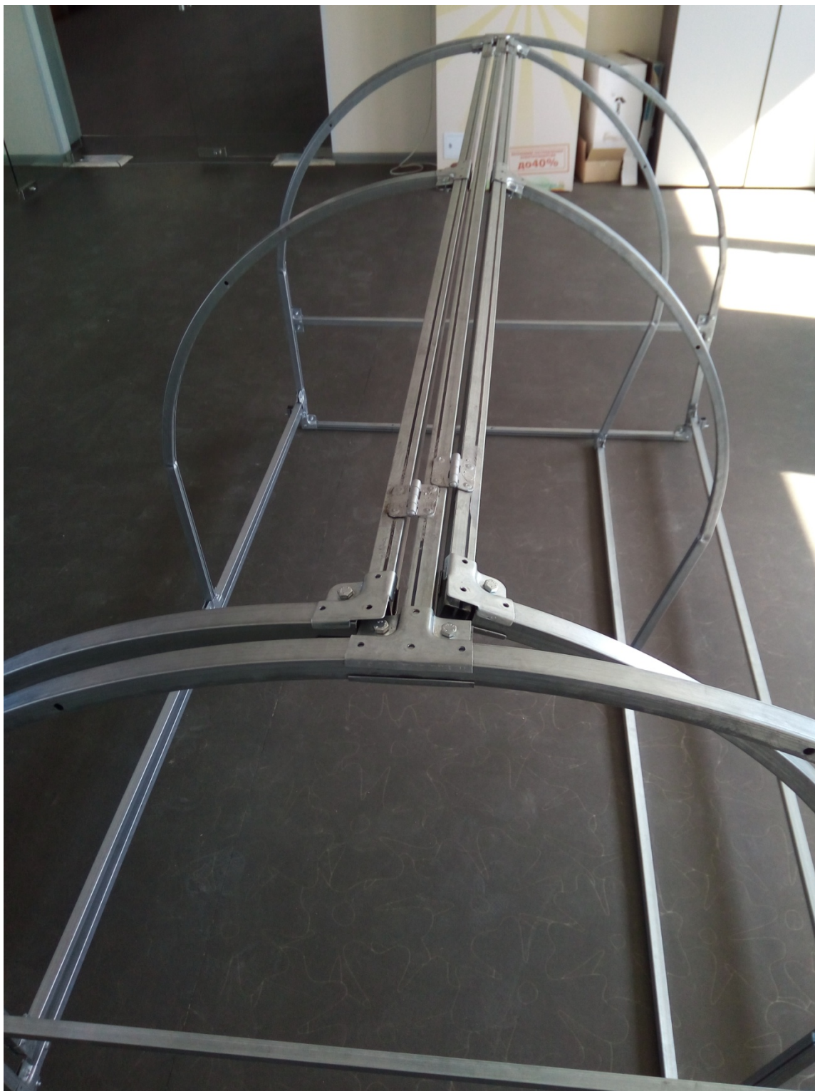
5. Установка упоров