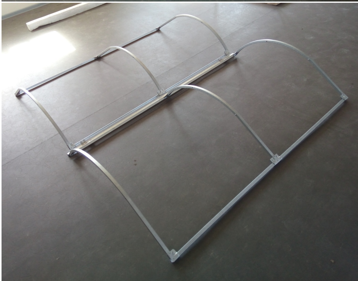
4. Установка створок